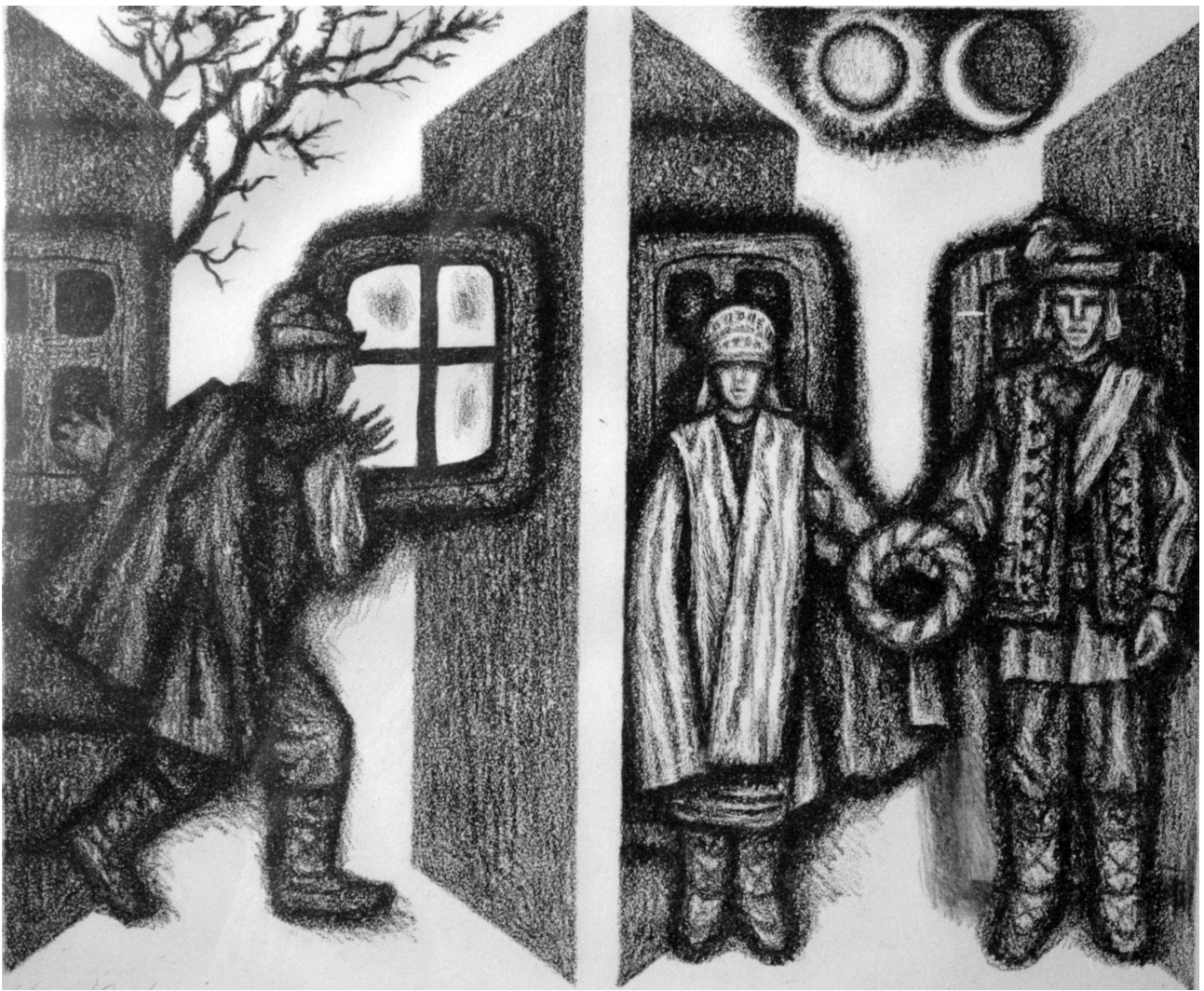
Іл. 3. А. Крвавич. Ілюстрація до твору Ю. Федьковича «Люба-згуба», літографія, 1985 р.

ленням правителя, зображеного у дивовижному польоті над самим містом (іл.1).