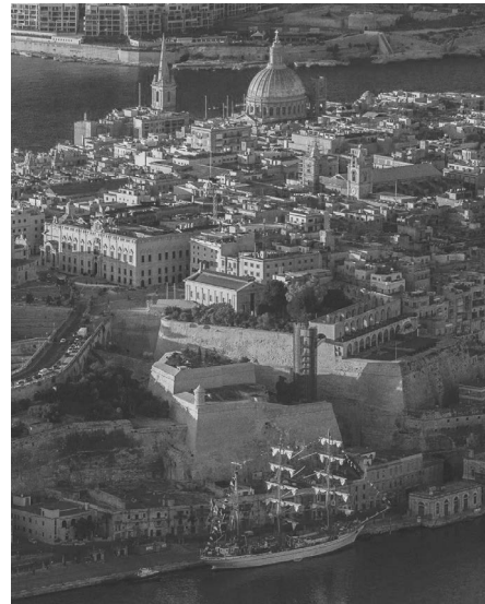
4. Креативний простір в Бастіоні святого Якова, Валлетта, Мальта

зентацію життя, пов'язану з новітніми технологіями.