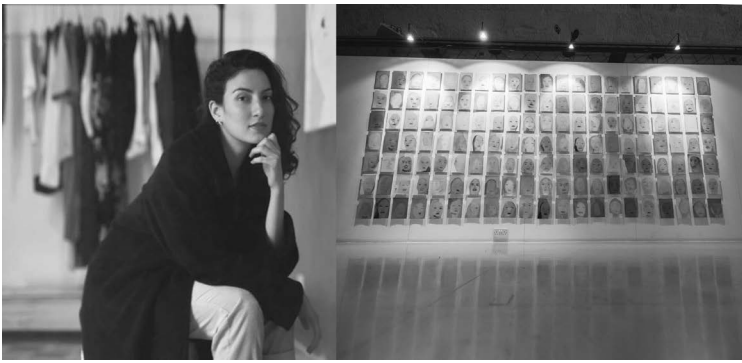
15, 16. Емма Фсадні «Промийте», «Арт + фемінізм 2020», Валлетта, Мальта