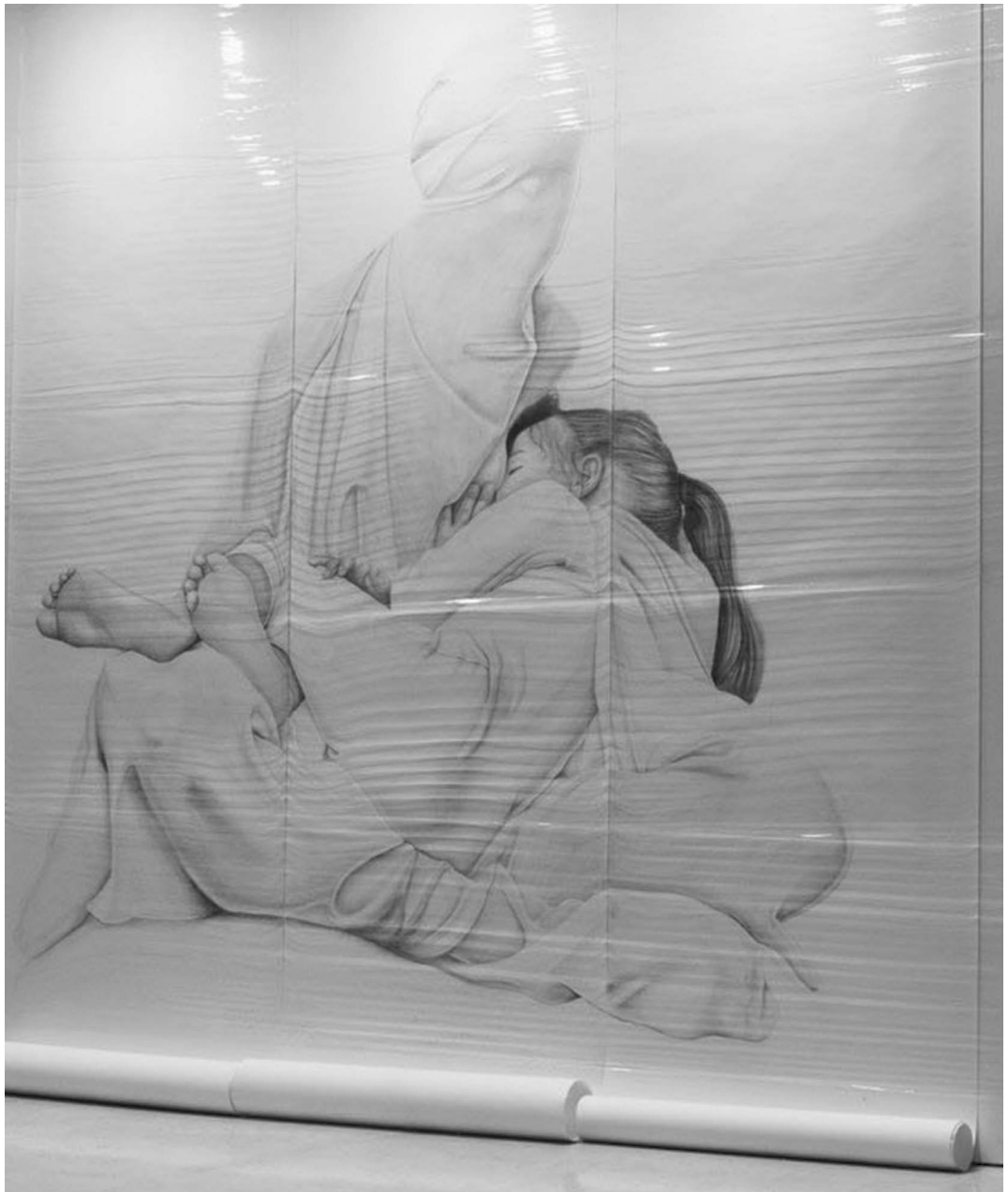
5, 6. Мір'яна Батініч «Рідке золото», «Арт + фемінізм 2020», Валлетта, Мальта