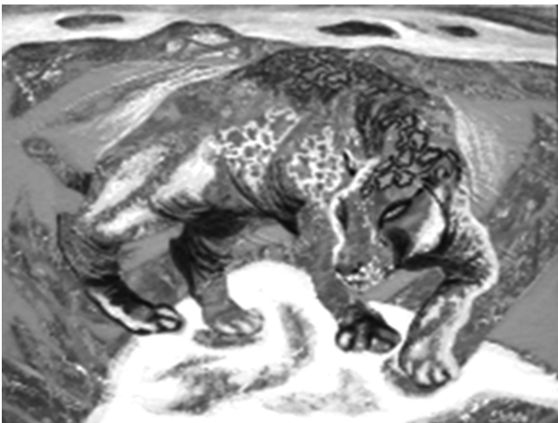
«Згусток енергії», 2018