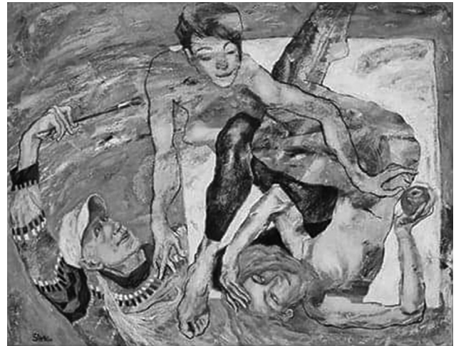
«Переродження Єви», 2021

ціальності 023 Образотворче мистецтво, декоративне мистецтво, реставрація у Вінницькому державному педагогічному університеті імені Михайла Коцюбинського. Творча школа О. Шиніна прославляє рідне місто, гідно представляючи його на всеукраїнських та міжнародних конкурсах і фестивалях у Франції та Чехії, Італії і Німеччині, Польщі та Японії.