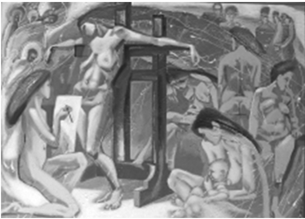
Зліва направо: «Ода», 2006 «Новий день», 2018