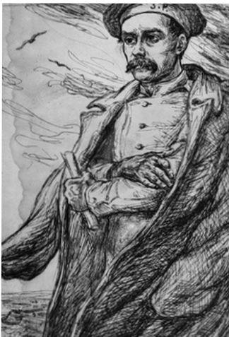
М. Штаерман. Портрет Т. Г. Шевченка. Папір, офорт

статті в довідниках — друкованих і електронних джерелах [1; 2; 3; 4; 5; 6; 7; 8; 9], тому публікація листів художника актуальна і важлива в дослідженні його діяльності.