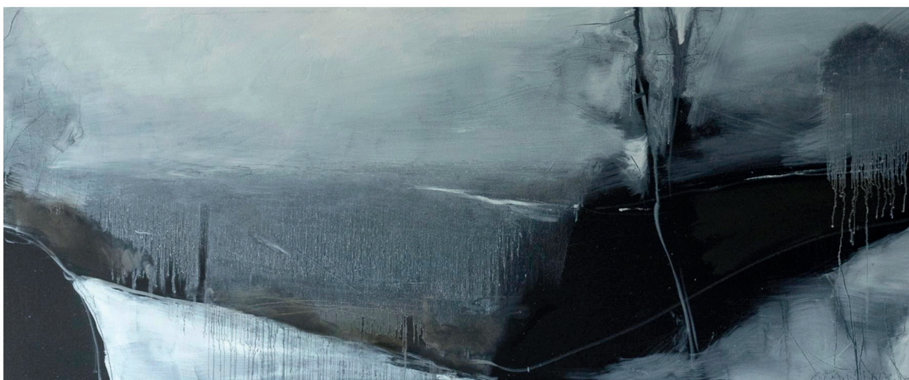
Іл. 13. Матвій Вайсберг. Вид на Дніпро з Пейзажної алеї. 2021.