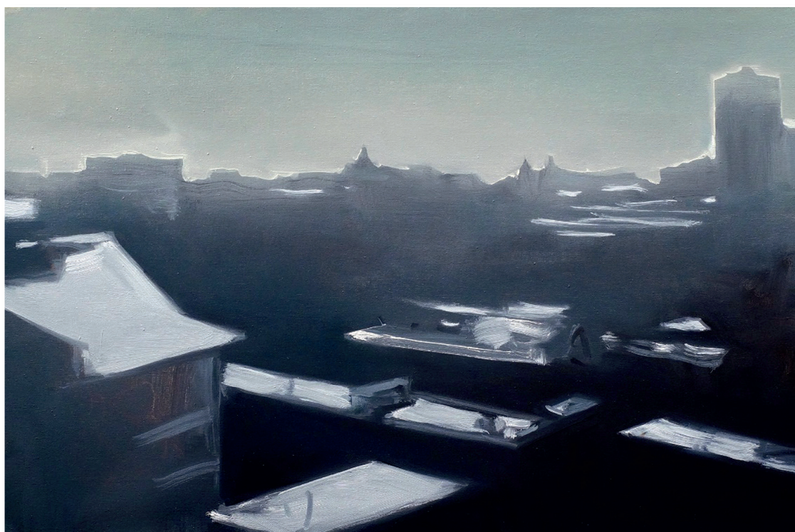
Іл. 12. Олексій Белюсенко. Чужий сніг. 2016.