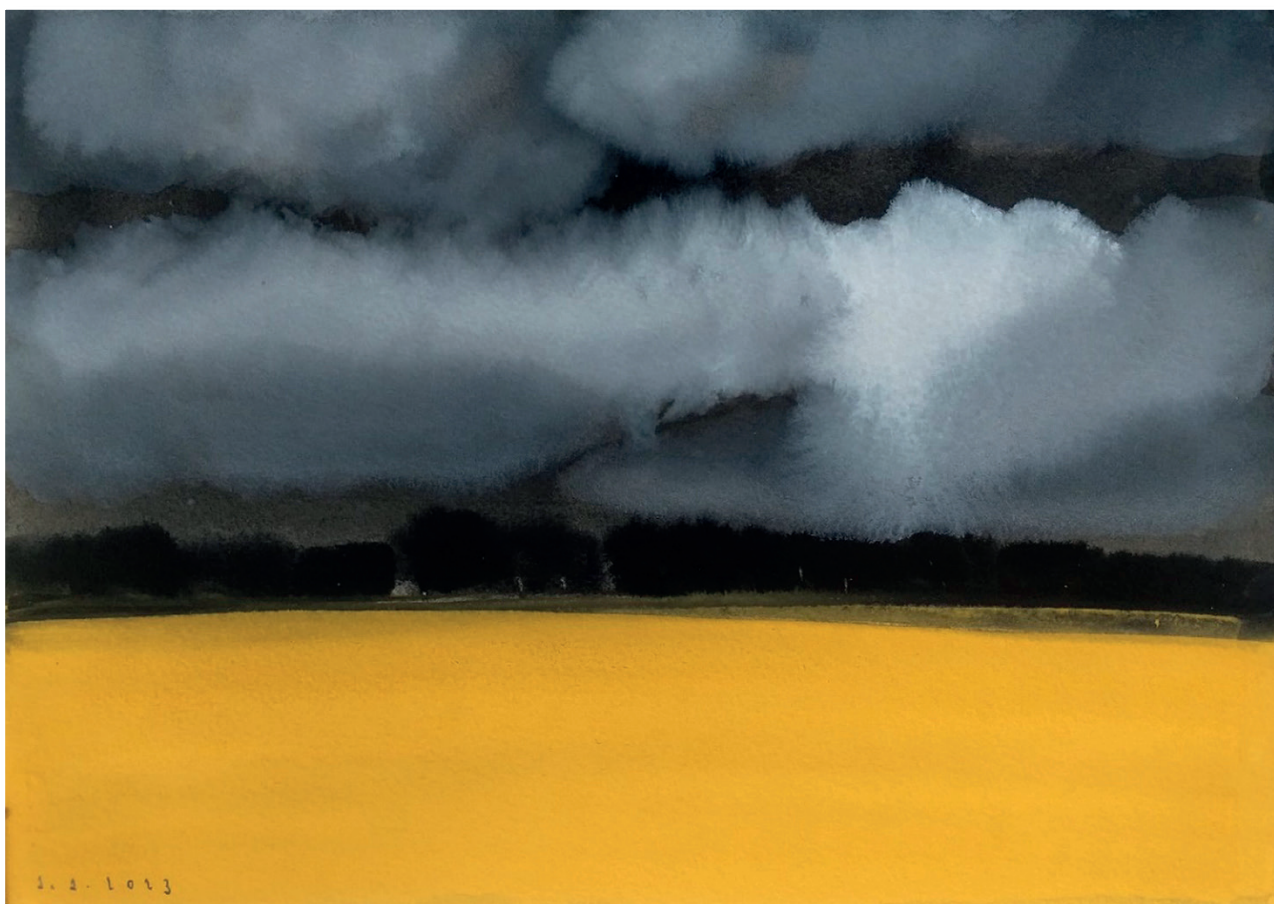
Іл. 7. Ахра Аджинджал. Пейзаж. 2023.